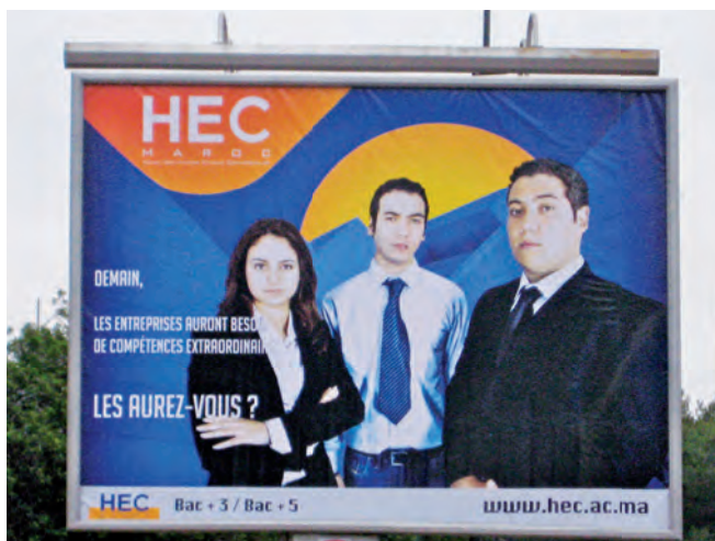
Fig. 3 : Photo illustrant la synergie entre francophonie et formation : une affiche publicitaire pour une école dans une rue de Rabat © Gérard-François Dumont, 2009.

Après avoir dressé le diagnostic quantitatif et qualitatif de la situation de la francophonie, il s'agit de réfléchir à ses conséquences stratégiques.